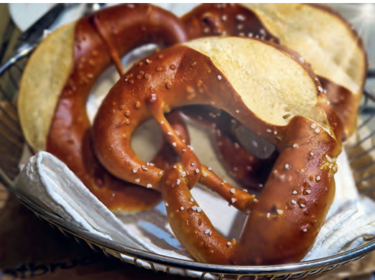
Von der Sonne verwöhnt – Brotbruders Badische Brezeln