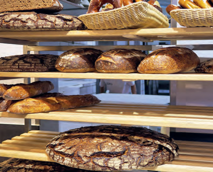
Kleines Helles, großes Dunkles – Roggendinkel, Semolina, Baguette