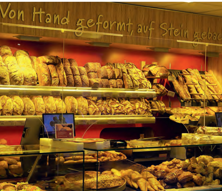
Volle Hütte – Pfeifle Innenstadtiliale in der Freiburger Schiffstraße