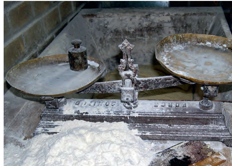
Das Universum beginnt mit dem Brot PYTHAGORAS