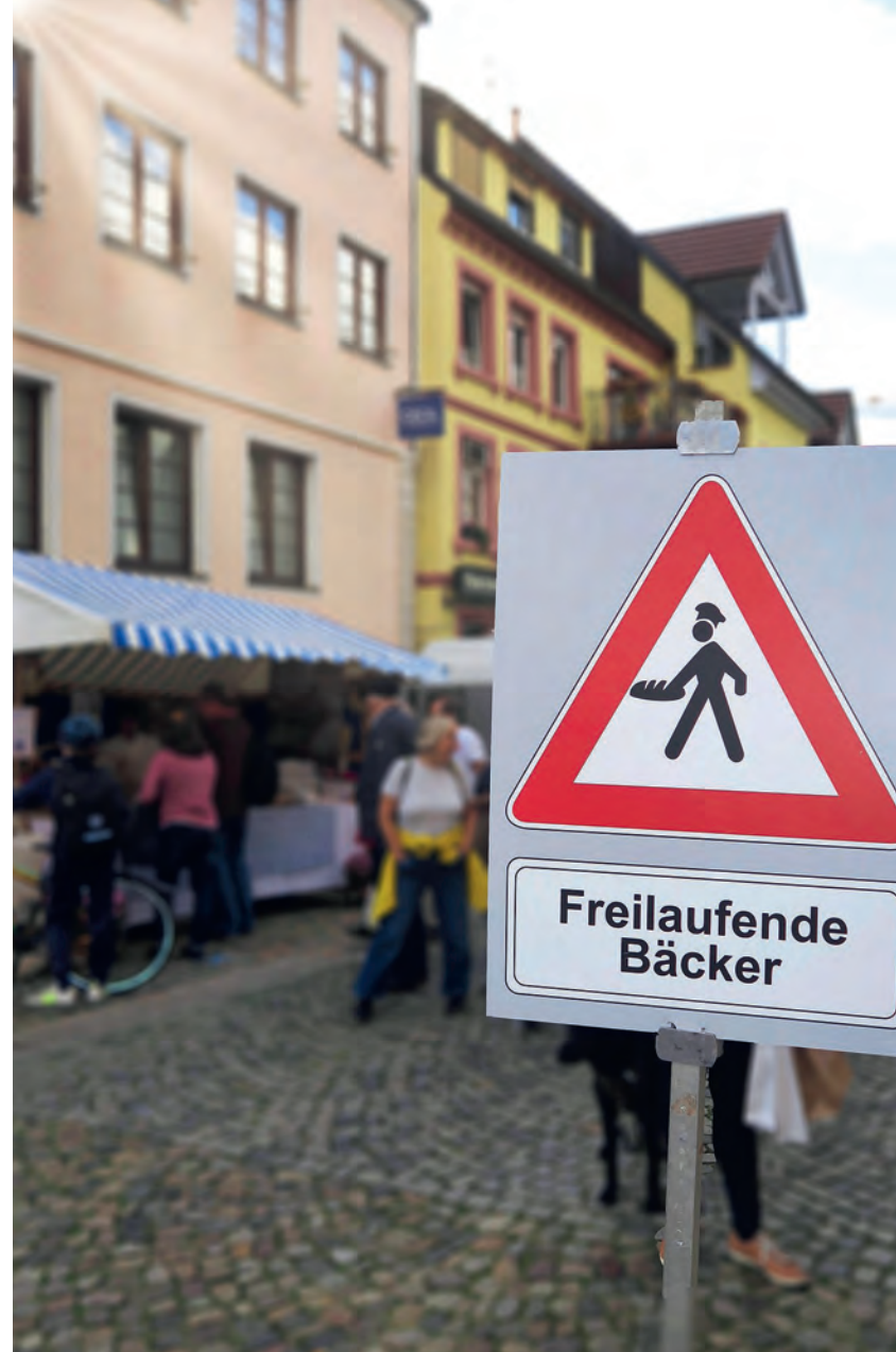
Endinger Brotmarkt (nächster Markt im Oktober '25)

Alle Angaben ohne Gewähr, weitere Hinweise sind willkommen, bitte an: info@oaseverlag.de (Stichwort BrotZeit).