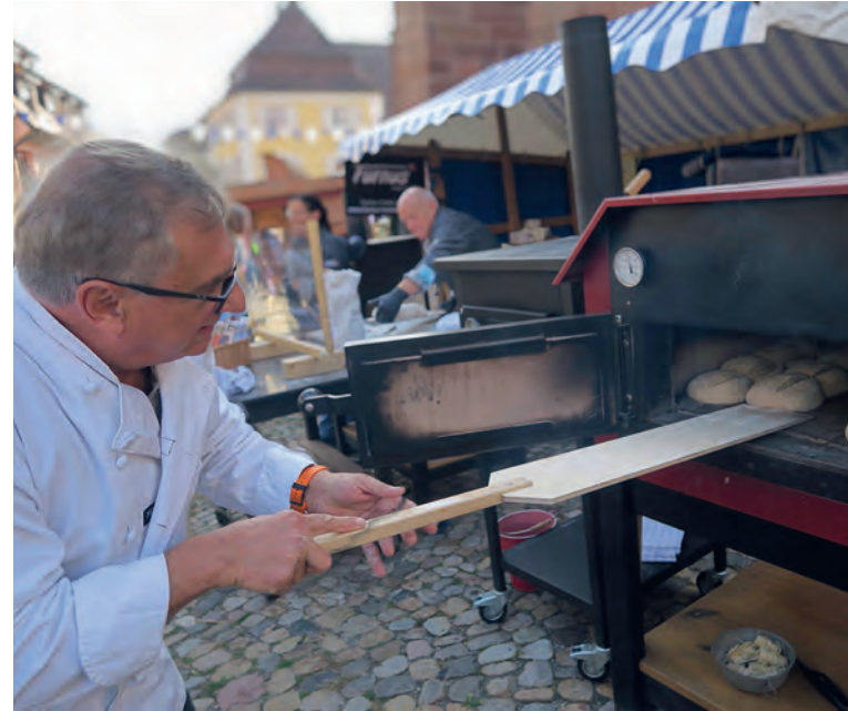
Beim Einschießen in den Furnus S 10 (auf dem Endinger Brotmarkt)

Neben führenden Marken für Eigenbrötler wie Häussler im Oberschwäbischen Heiligkreuztal ( backdorf.de ), bietet der Ortenauer Hersteller Furnus mit seinen zwei Kleinserienöfen und