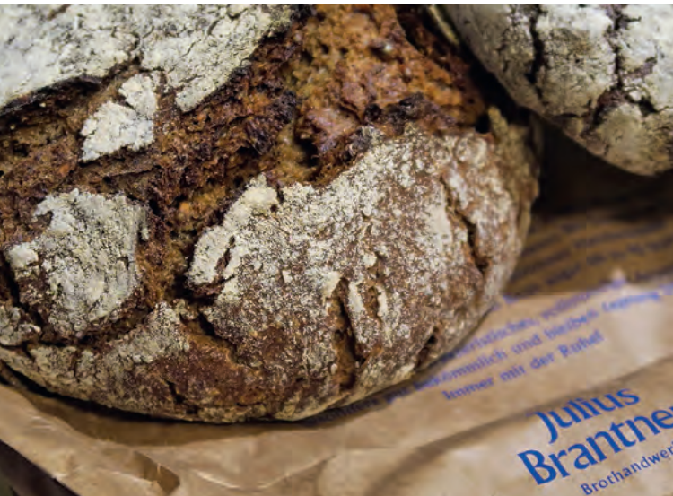
Einzelstück mit Charakter – der Münchner Hauslaib

mit ordentlich aromatischem Schmecker. Die wild aufgerissene Rinde von „Münchener Hauslaib“ und „Lichtkornroggen“ erinnert an eine alpine Landschaft. Die saftig-dunkle Krume mit einzelner Vollkorn sorgt für rustikalen Biss. Bäckers Lieblingsbrot, das „Brothandwerk 25“ aus Weizenvollkorn- (60) und Roggenmehl (40) wirkt mit der Rautenkruste und einer homogen-weichen Krume deutlich kultivierter und universeller.