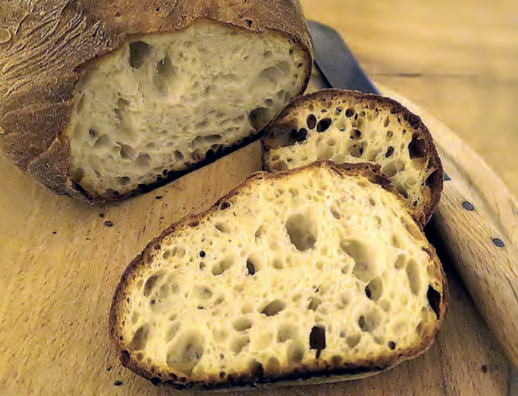
Rösche Kruste, weiche Krume – Baumgartners Holzofenbrot, Görwihl