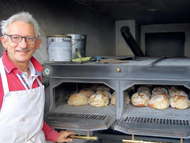
Halbzeit im Ofen – Holzofenbrot vom Schmidt-Beck