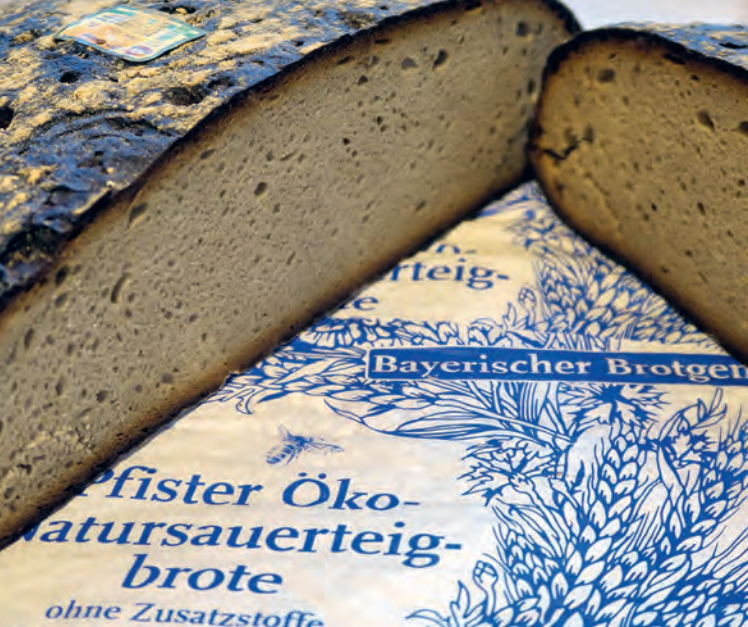
Großes Schwarzes – Pfister Öko-Sonne schwarz

Referenzbetrieb mit selten langer Traditionslinie. Ein 2004 von der Hofpfisterei aufgelegter Prachtband würdigt die 700-jährige Geschichte der Institution, die auch eine Kulturgeschichte der Landnutzung und Ernährung in Bayern ist.