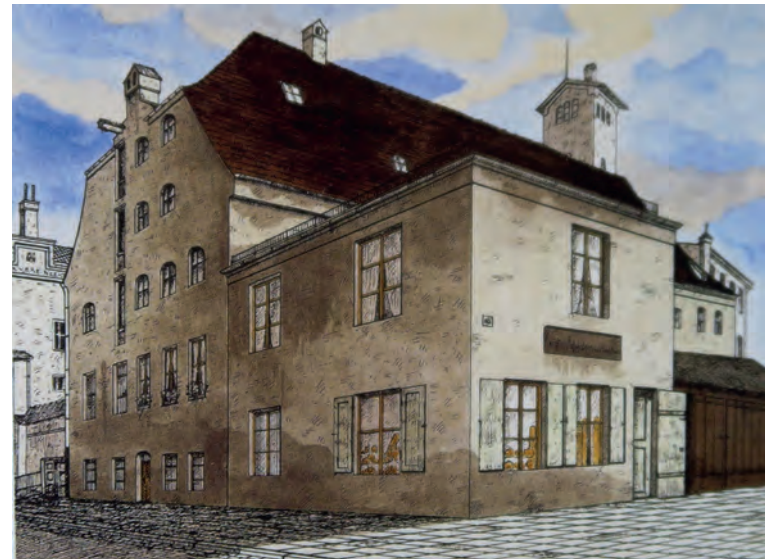
Ehemals kgl. Hopffisterei, erb. 1579, zu Beginn des 20. Jh.

Auch bei den Hellen in Brantners Sortiment gilt Klasse statt Masse: rösche Münchner Handsemmel, Konrads Krusties, ein Französisches Landbrot, sowie Croissants und Süßgebäck je nach Wochentag. Natürlich ist alles Bio. Nebenbei: Der japa-