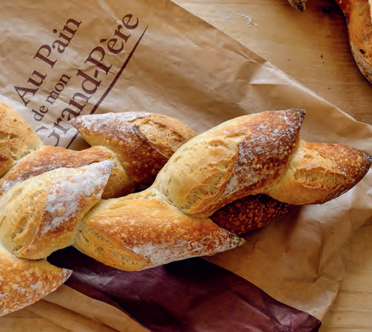
Direkt aus dem Holzbackofen – Pain d'Épi (Ährenbrot)