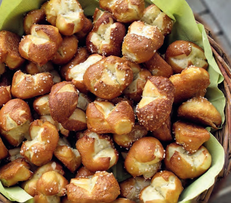
Gibt es nur bei Eigenbrötlern – Laugenweckle frisch aus dem Ofen