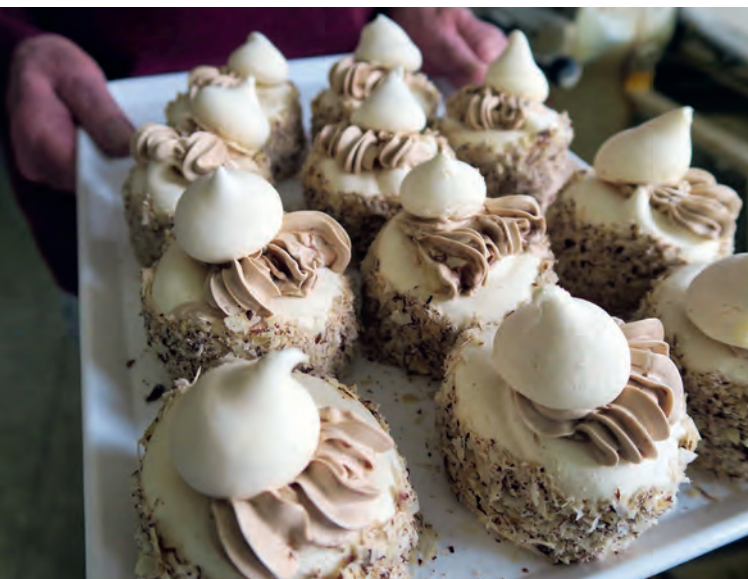
18 Kein Vollkorn, aber sehr genießbar – Japonais aus Niederwühl