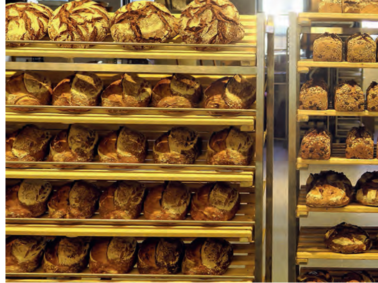
Gebackene Leidenschaft – Sauerteigsortiment bei Till & Brot