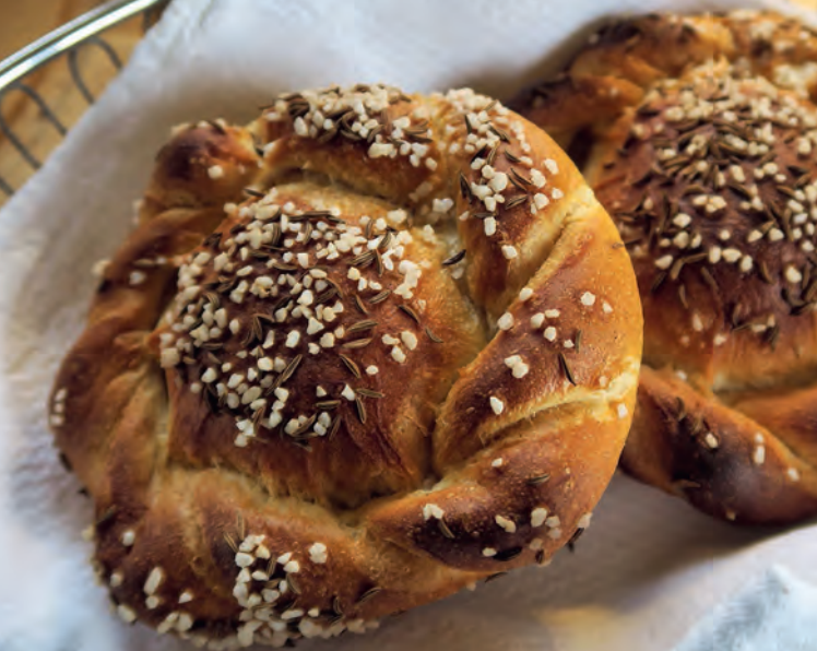
Sonderanfertigung aus Niederwühl – handgeschlungene Salzweckle