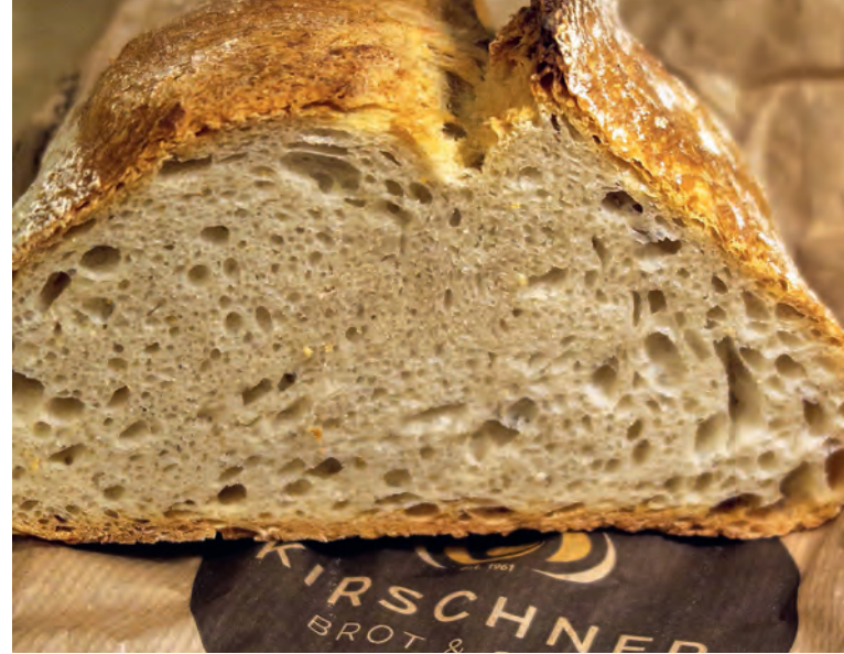
Außen krustig, innen fleischig-saftig – Terra Madre von Kirschner

☒ Hauingerstraße 2 (Straßenaufsteller am Backtag), Lörrach-Haagen, Donnerstags von 8 bis 18 Uhr (s'hett, solange's hett, deshalb möglichst nicht erst kurz vor Ladenschluß kommen).