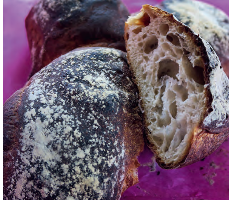
„Im Holzooefe fascht schwarz bagge“ – Büürli von bread in Basel

✉ 58 rue de Krutenau (täglich geöffnet !) zwei weitere Filialen in Strasbourg, weitere in Schiltigheim und La Wantzenau. aupainde-mongrandpere.fr