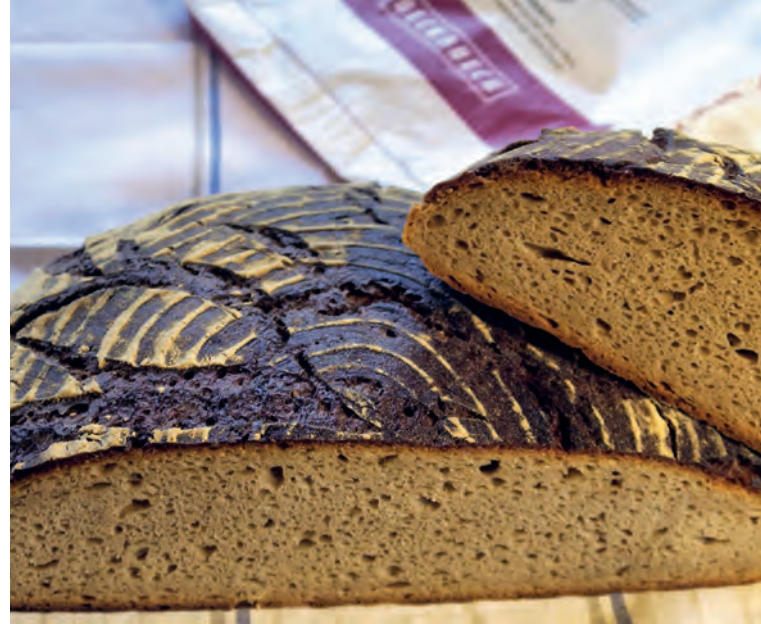
Zwei Kilogramm Geschmack – Beckabecks "Albkruste"