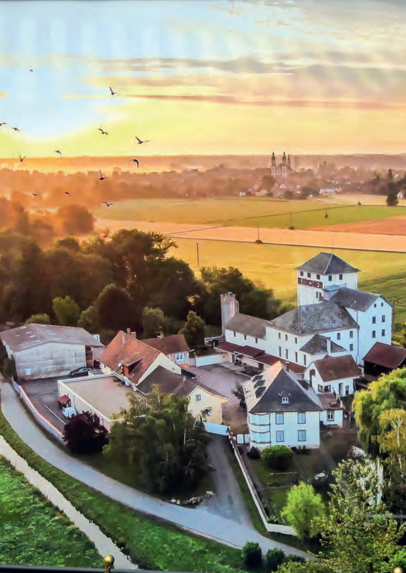
Kleine Welt für sich – Moulin Kircher, zw. Ebersheim und Ebersmunster